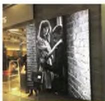
лайтбоксы и фрейм системы